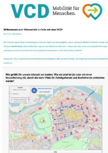
Umfragetool des VCD